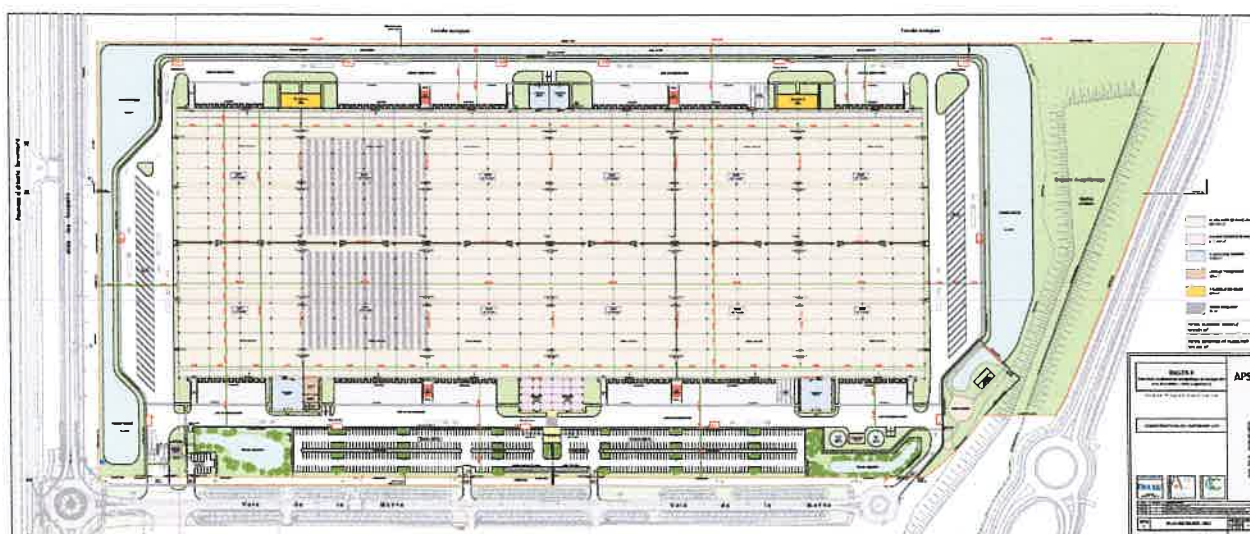
Plan de masse

Le bâtiment d'entreposage est destiné à recevoir de l'électroménager (petit et gros), ainsi que des appareils électroniques et informatiques (portables, tablettes, équipements vidéo, etc.). Des produits classés dangereux (aérosols) seront entreposés mais en quantité réduite (sous le seuil déclaratif au titre de la réglementation des installations classées pour la protection de l'environnement).